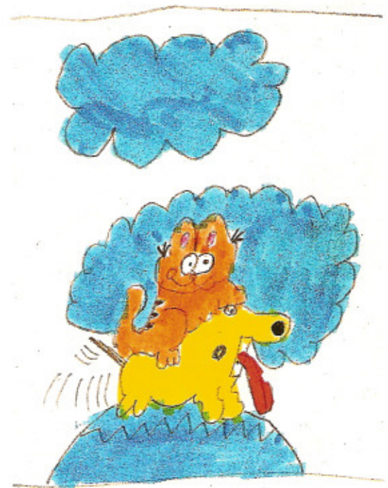
Abb. rechts Glück im Unglück, Bild 2 Julian, 9 Jahre Garfield steigt auf Odie wegen der besseren Aussicht, Odie sieht nichts mehr und stolpert