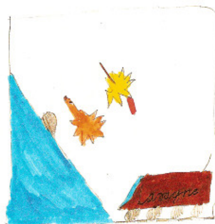
Abb. unten Glück im Unglück, Bild 4 Julian, 9 Jahre ... aber siehe da am Fuße des Berges ...

Der Clou am Comic ist ja gerade, dass selbst unangenehme Gefühle und Erfahrungen mit Hilfe der Kunst in witzige Geschichten umgewandelt werden können und damit eine neue Bewertung erfahren, die eine emotionale Verarbeitung erleichtert. Die Speicherung, der im kreativen Prozess so aus einem neuen Blickwinkel gesehenen Eindrücke, ist nicht problemorientiert, sondern lösungsorientiert - das Comic löst sich vom Problem, indem es das Problem einer Lösung und den kleinen Künstler der „Erlösung“ zuführt.