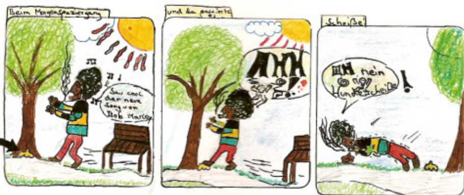
Beim Morgenspaziergang ... und da passiert es ... scheiße

Comicserie Das Leben des Jamaica Freaks Frederik, 11 Jahre