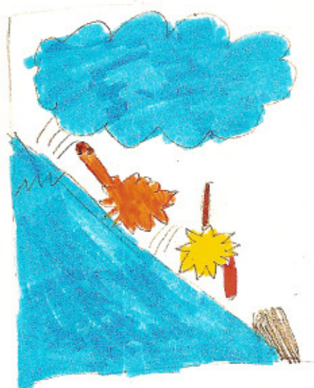
Abb. oben Glück im Unglück, Bild 3 Julian, 9 Jahre Garfield und Odie im Sturzflug ...

Ressourcenorientierte Counselor-Zusatzausbildung Fachrichtung Kunst- und Gestaltungstherapie in der pädagogischen und medizinisch-therapeutischen Praxis